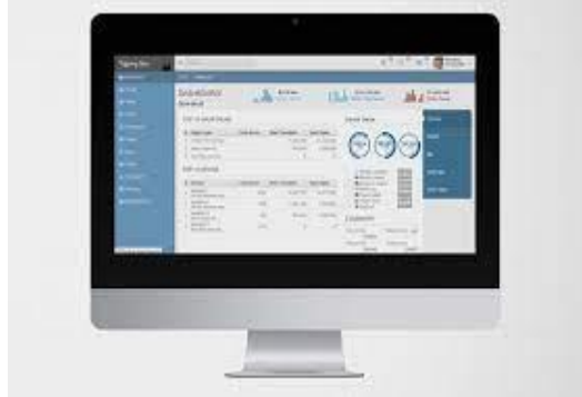
Gambar 2 Proses Data Monitoring