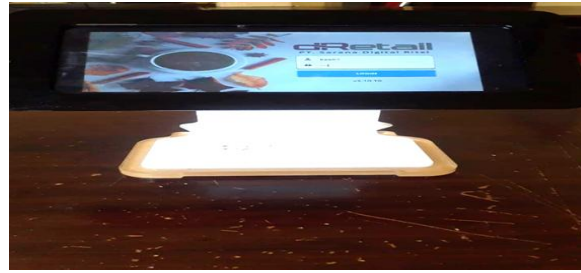
Gambar 4. M-Pos