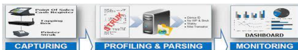
Gambar 1 Alur Sistem Monitoring