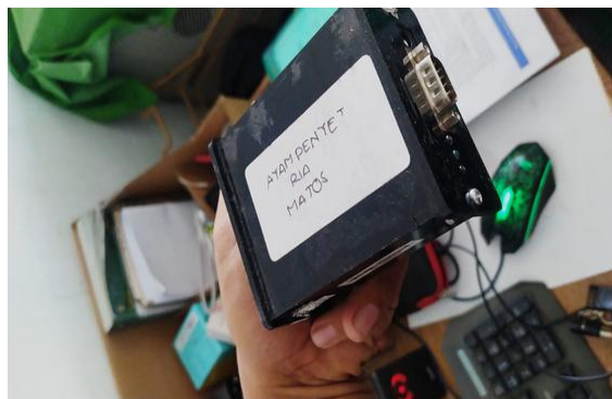
Gambar 3. TMD